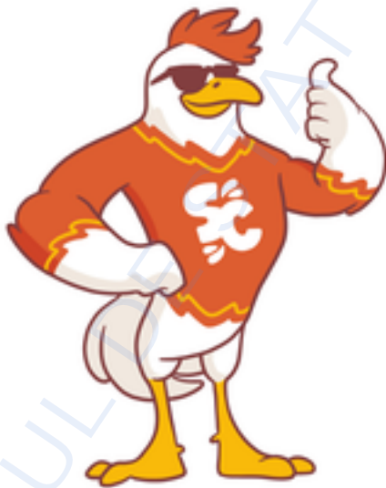
Mascota SPLENDID CHICKEN

(531) Clasificare Viena: 03.07.03; 29.01.14