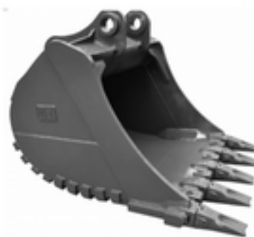
ARDEAL EXCAVATII SI AGREGATE