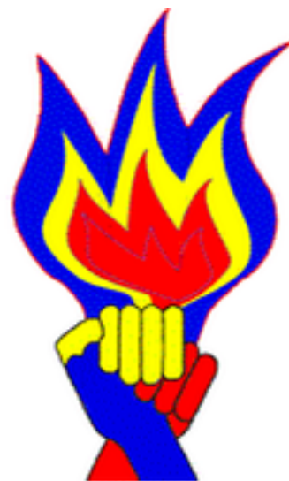
UFP UNIUNEA FORTELOR PATRIOTICE